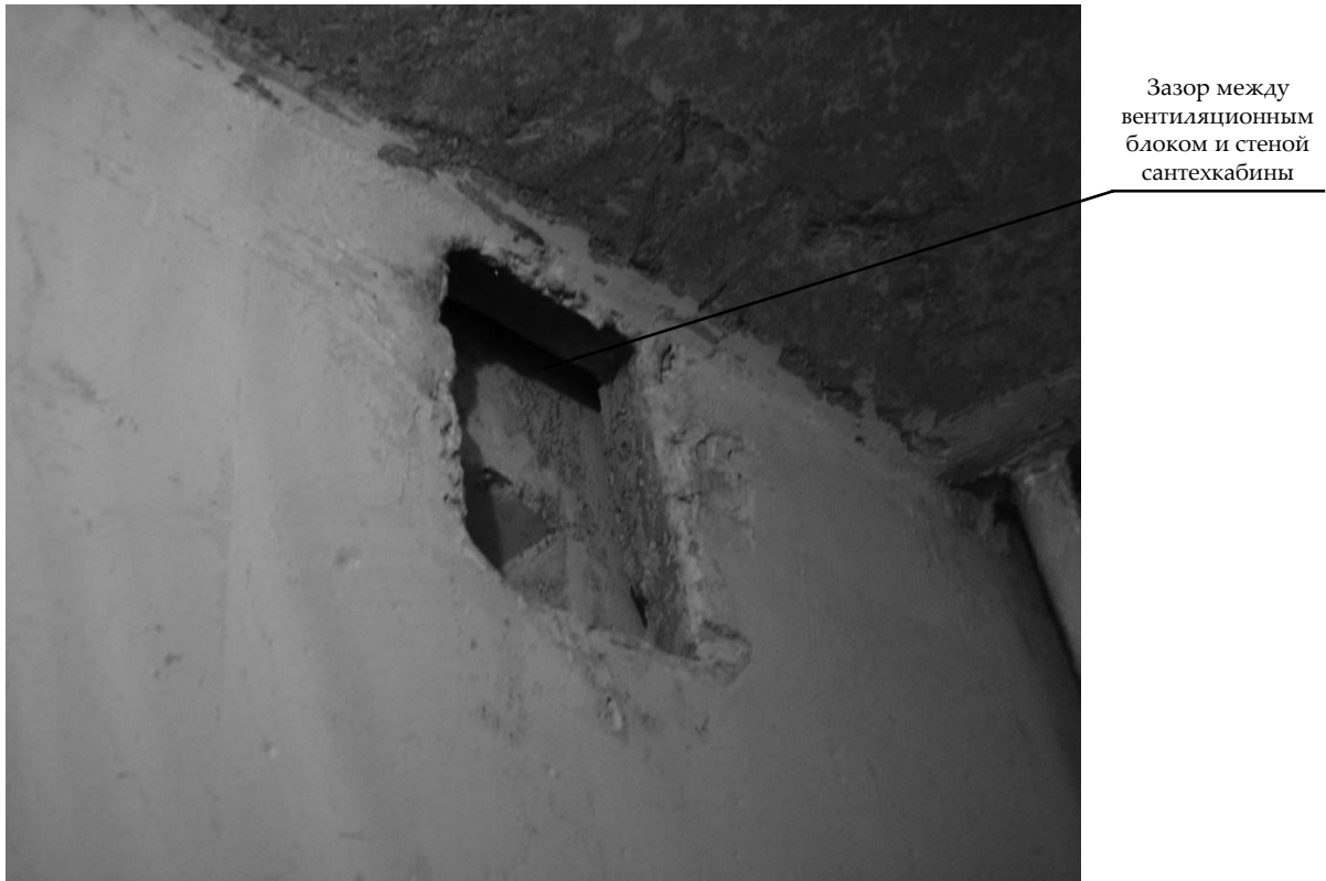
Рис. 4. Выход вентиляционного отверстия сантехкабины в вентиляционный блок