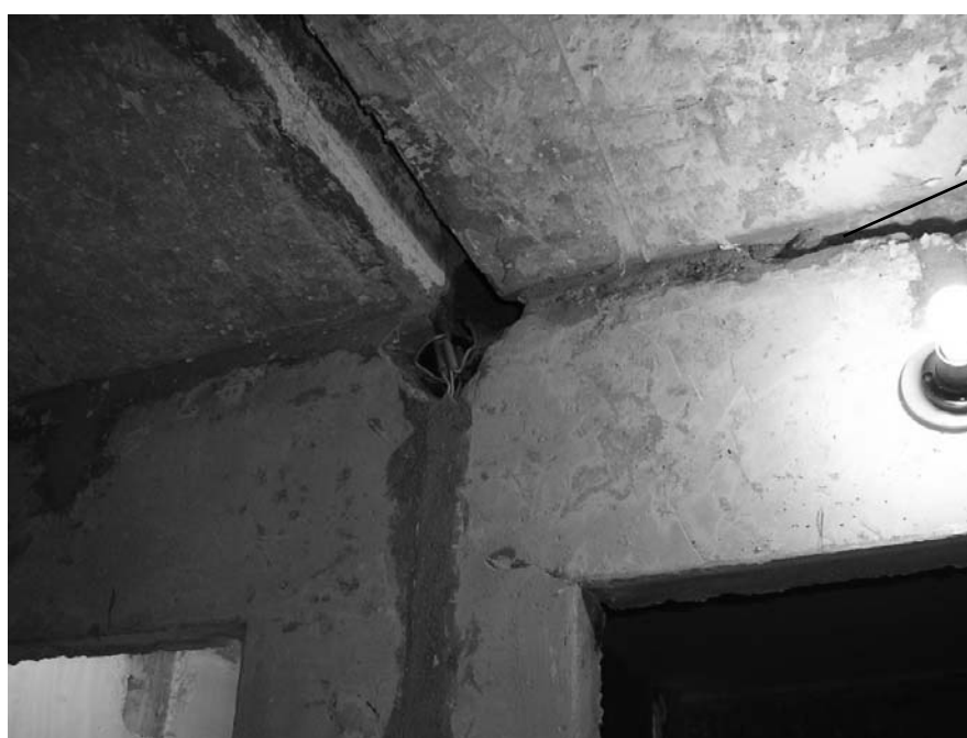
Зазор между плитой перекрытия и плитой сантехкабины