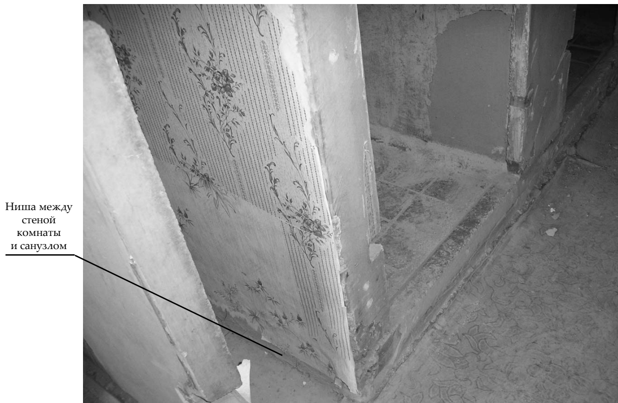
Рис. 5. Расстояние между стеной комнаты №2 и помещением №7, равное 27 см